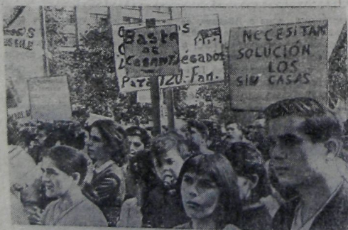
САНТЬЯГО. «Довольно безработицы», «Бездомные ждут решения их проблемы», «Хозяйка обогащается, а нам подбрасывают к зарплате лишь гроши», — под такими лозунгами прошла в столице Чили демонстрация безработных и не имеющих жилищ чилийцев.