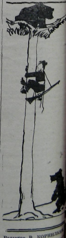
Редактор В. КОРНИЛКОВ

Наш кинематограф не раз предпринимал интересные и глубокие исследования чувств человеческих, знал на этом пути серьезные достижения, накопил немалый опыт. О чувствах и прежде всего о любви вкратце рассказать нам и авторы фильма «Любовь Серафима Фролова» (по повести «Необходимый человек», режиссер Тулянов, студия «Мосфильм»). Вернулся после войны, после госпиталя хороший парень Серафим Фролов и прямоком к Насте, в которую влюбился по переписке. Но Настя не хочет его любить, гонит с порога. И тогда Серафим решает испод-