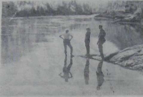
В гостях у царя леба — Качегира.