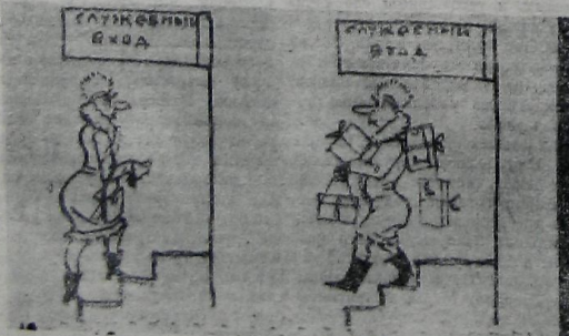
Служебный вход... и выход! (Иллюстрации к работе промтоварного магазина № 1 пос. Майна). Рис. В. ЕПАНЧИНЦЕВА.

Слабшемы МКД-5 проворонили своевременную заготовку простейшего материала — песка. (Из выступления делегата на 4-й профсоюзной конференции).