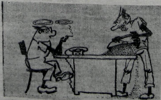
— Я вчера из отпуска, с Рижского взморья... Ставь полбанки за чемодан балтийского стройматериала! Рис. В. ЕПАНЧИНЦЕВА.

ИРКУТСКАЯ ОБЛАСТЬ. Го назад к берегам таежной Гза на станцию Зима пришли строители. Им предстоит возвести здесь корпуса мощного химического комбината, который будет выпускать полимерные материалы.