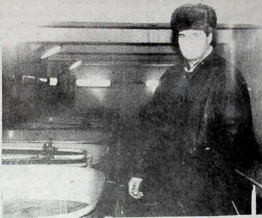
В цехе предприятия