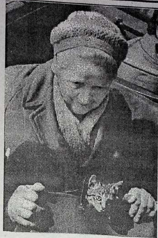
Сегодня в нашем городе начинается месячник пожилых людей. Здоровья вам, наши дорогие!