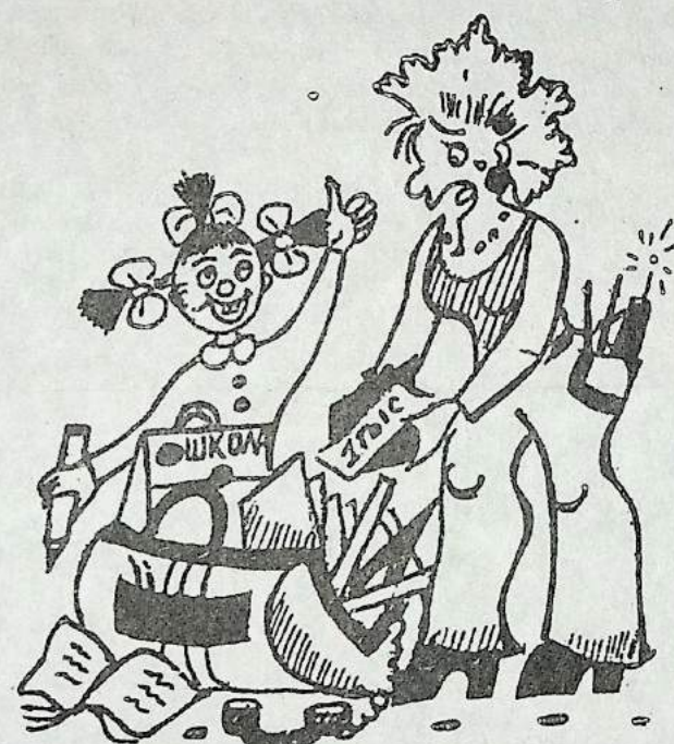
лю, все равно к новому учебному году нужно хорошенько подготовиться, чтобы потом проблем не возникало.

Вот такие разные ответы я получила. Но как бы то ни бы-