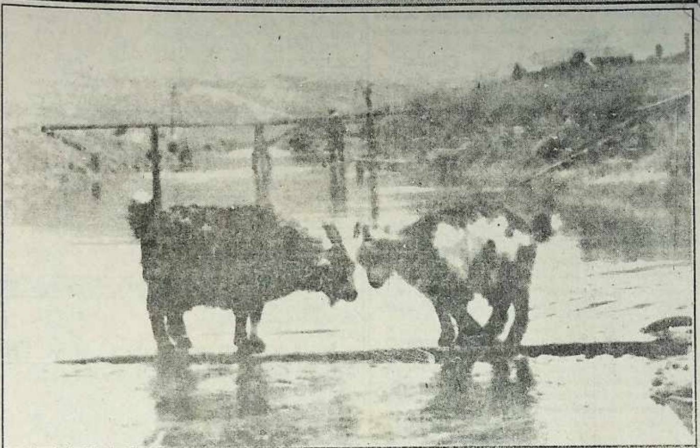
Не легко дается компромисс

На вопросы отправлять в адрес редакции. Можно присылать ответы и активные участники ждут призы и сор-