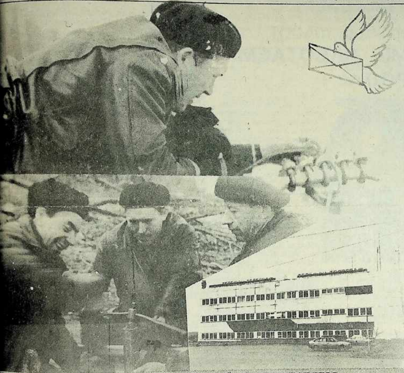
ТАК РОЖДАЛСЯ ОЗНАЧЕНСКИЙ ТВ-РЕТРАНСЛЯТОР

Родительский день — день поминовения усопших пришел к нам из древней Руси, когда пришло на нашу землю христианство. Брат ли, отец ли, жена, дочь — все земля принимает и все останется память у живущих ныне.