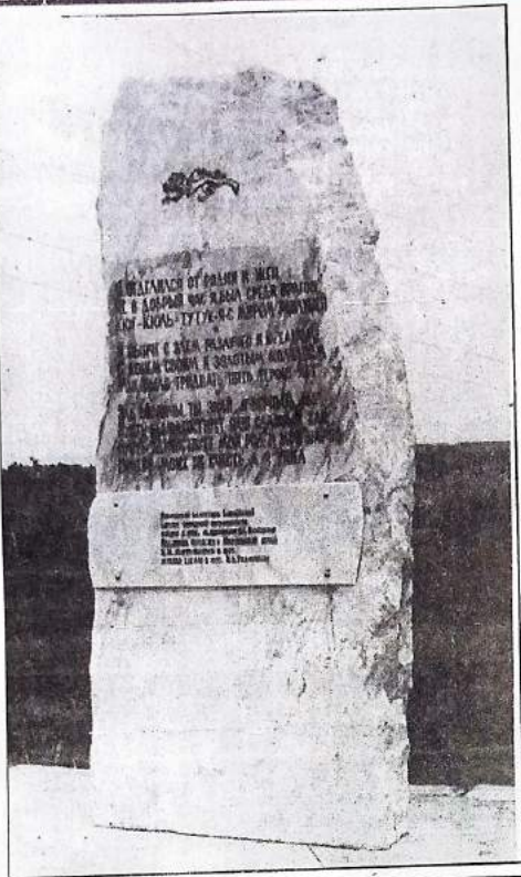
Мраморная копия камня-менгира, установленного в районе магазина "Амыл"