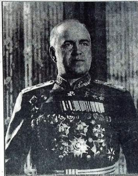
Выборы - 96

По поручению Совета ветеранов написал В.А. ОРЛОВ