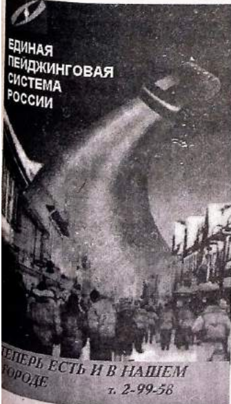
ТЕПЕРЬ ЕСТЬ И В НАШЕМ ГОРОДЕ т. 2-99-58

Хотя и.о. Генерального директора СаАЗа и мэр города подписали соглашение, предполагающее перемирие, время покажет дальнейшую политику администрации СаАЗа. Медиков или стоит! Кстати, эти "товарищи"