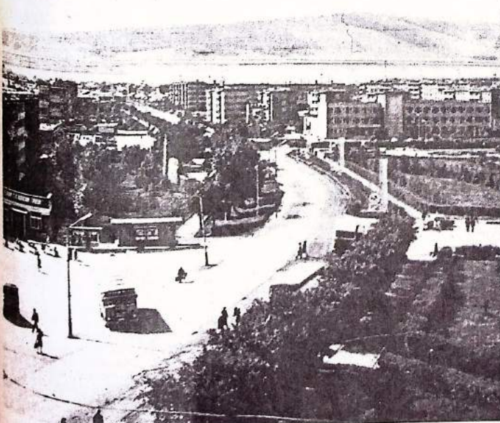
Саяногорск хорошеет с каждым годом...