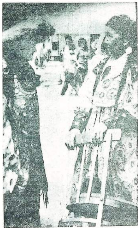
На снимке: хакаски, национальная одежда.