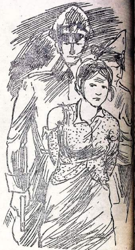
Партизанка. Рис. С. Токарева.

А. КАЗАРОВ, помощник прокурора г. Саяногорска.