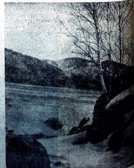
На снимке: Февральские ясные дни.