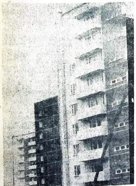
На снимке: в доме № 18, который строит фирма «Саянстрой», уже многие саяногорцы отпраздновали новоселье.