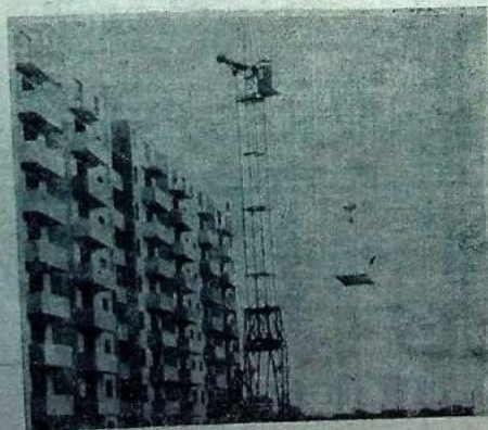
Высотные дома, возводимые фирмой.