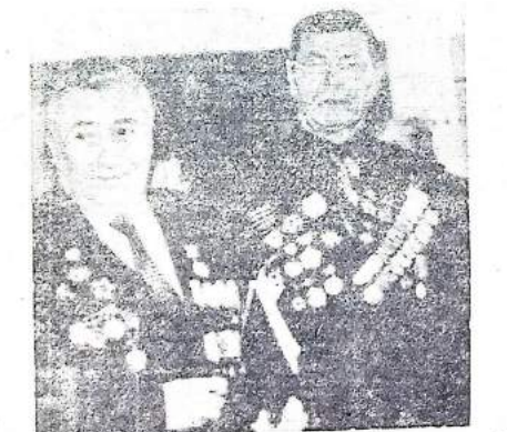
Саяногорцы — ветераны Великой Отечественной войны.