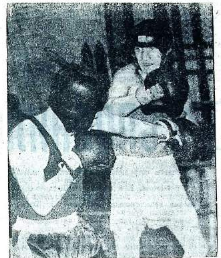
▲ АО «САЯНСТРОЙ»: НОВОСТИ

Как же вы намерены жить, господа акционеры? В. КУКЛИН, обозреватель «ДС».