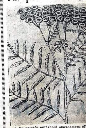
По просьбе читателей продолжаем публикацию терминалов из книги «Лесная фитотерапия» В. Червоного (п. Сизая).

час лед мой в больнице лежит, вот от него этот год опять много было да не пробовала, а в их так люблю. С моими ногами в горы не пойду.